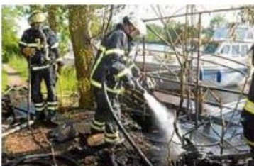
Die Feuerwehr löscht das Feuer am Bootssteg.

Moorfleet. Die Feuerwehr ist am Sonnabend gegen 18 Uhr zum Moorfleeter Deich ausgerückt. In Höhe der Hausnummer 359 hatte ein Bootssteg Feuer gefangen. Die Polizei vermutet, dass ein technischer Defekt, vermutlich Kabelbrand, in einem Verteilerkasten das Feuer ausgelöst hatte. Die Retter löschten die Flammen, die bereits auf einen Zaun, Baumstümpfe sowie eine Mülltonne übergegriffen hatten. Der Moorfleeter Deich war für den Einsatz gut 40 Minuten voll gesperrt. cl/ld